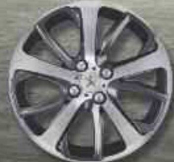
Jante aluminium 17" diamantée OXYGENE Technical Grey