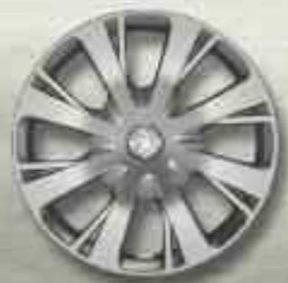
Enjoliveur tôle 15" NIOBIUM