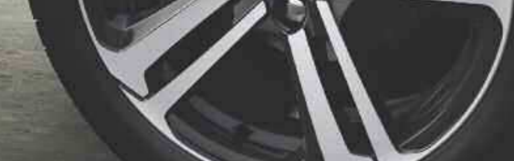
Jante aluminium 17" diamantée CAESIUM***