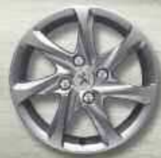
Jante aluminium 15" AZOTE