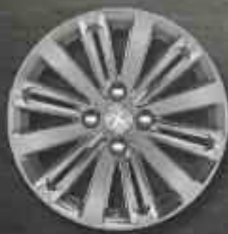
Jante aluminium 16" TITANE Gris Hephais