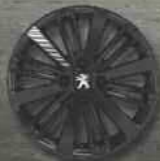
Jante aluminium 16" TITANE Noir Brillant, gravage laser blanc