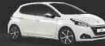
Blanc Perle Nacré