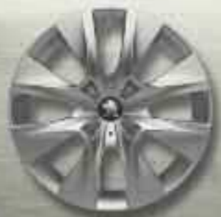
Enjoliveur tôle 15" BORE**