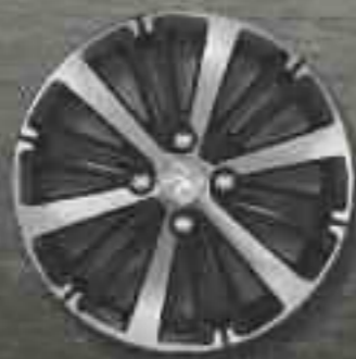
Jante aluminium 16" TITANE Technical Grey Brillant, diamantage classique